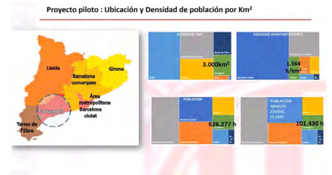
Proyecto Barnahus en Tarragona. Ponencia de Ester Cabanes.