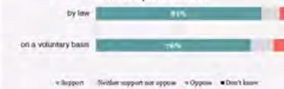
Resumen de los resultados de la encuesta. Ponencia de Amy Crocker.

¿En qué medida apoya o se opone a que los proveedores de servicios en línea utilicen herramientas automatizadas para detectar, informar y eliminar material de abuso sexual infantil y/o captación de datos en sus plataformas?