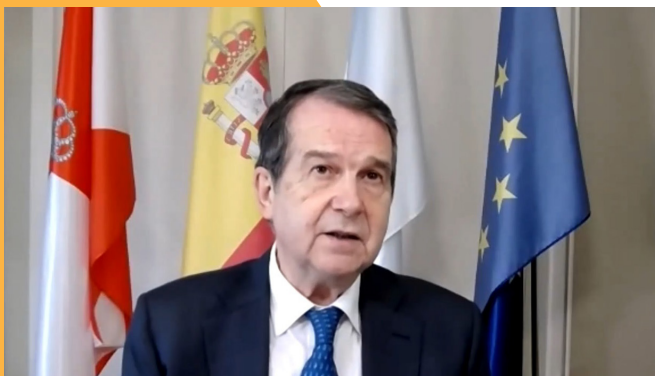
Abel Caballero Álvarez - Presidente de la Federación Española de Municipios y Provincias (FEMP)

estratégico en la primera ola de la pandemia, brindando servicios y ayudas a los ciudadanos y garantizando suministros básicos.